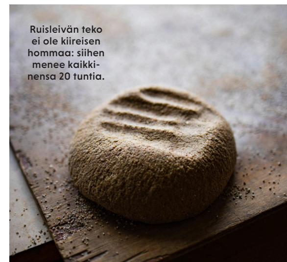
Ruisleivän teko ei ole kiireisen hommaa: siihen menee kaikkiansa 20 tuntia.

TEKSTI ELINA KILPINEN